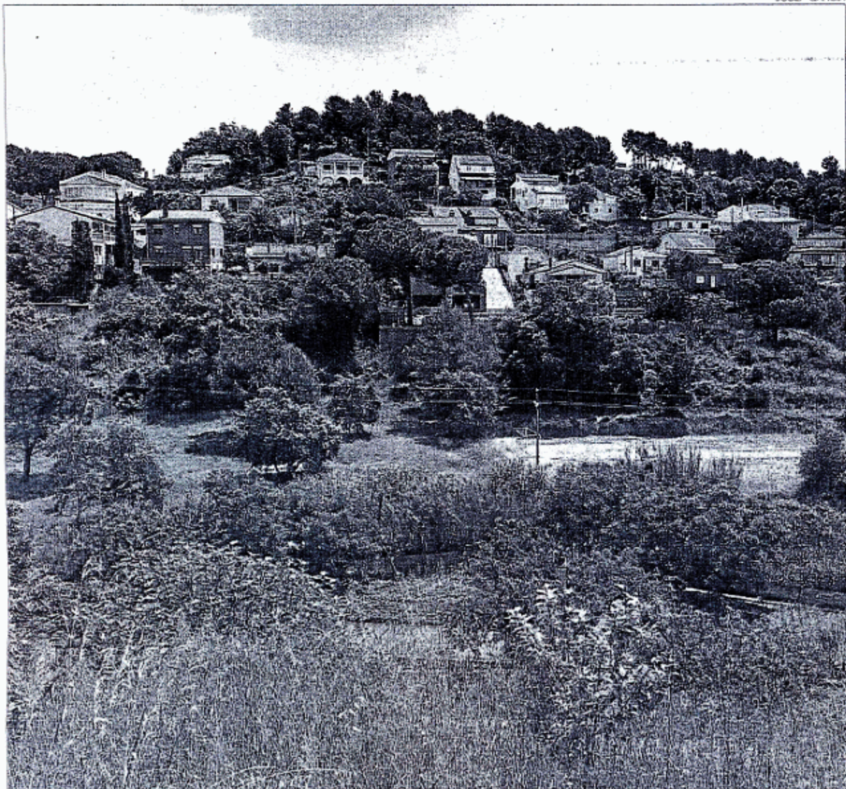
SENTMENAT ▶ La urbanització Can Caryameres, on els veïns van denunciar abocaments d'aigües fecals.

i gairebé anecdòtica». Al seu entendre, és una actitud que «lamentablement sembla persistir qualsevol que sigui l'Executiu que governi la comunitat». Aïgeix que quan es denuncia són «fets nimis o sense cap mena de significació penal».