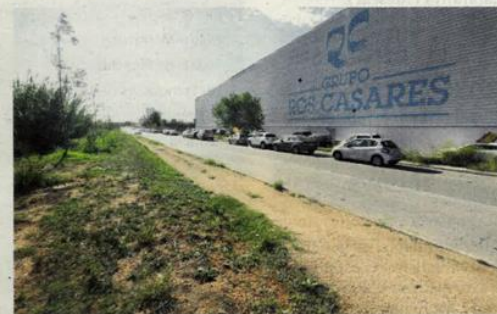
El tram final del camí que es va millorar davant de l'antiga Ros Casares

Isnard destaca l'oportunitat d'afrontar una actuació en aquest punt lligada al projecte per generar una gran ruta per a ciclistes que connecti Barcelona amb el Pirineu travessant el Vallès i Osona. També per aconseguir finançament. "Són opcions que l'any 2005 no hauríem imaginat mai que podríem tenir", sosté.