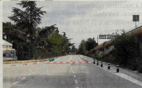
Un dels trams de carril bici segregat de la ruta de la Tourdera on es treballa