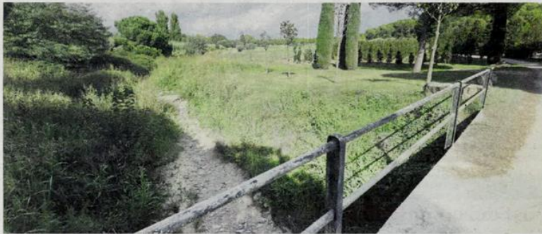
La riera de Vallfornès amb el camp de golf al fons vist des del pont que dona accés a Viviers de Cardedeu