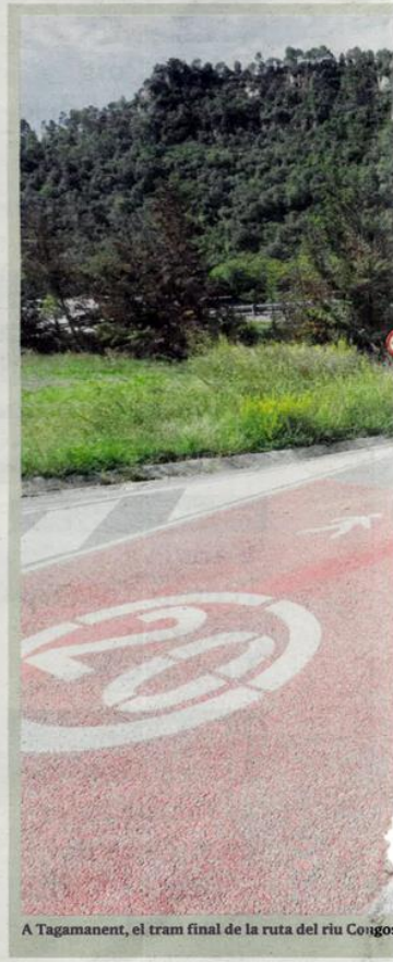
A Tagamanent, el tram final de la ruta del riu Congost