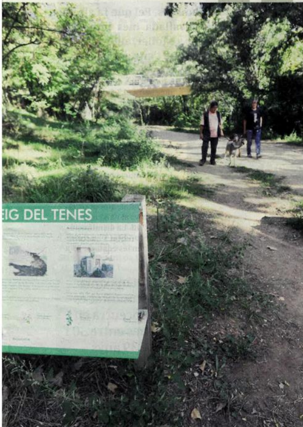
que s'han instal·lat al tram de camí situat entre el nucli de Bigues i el poble de Riells

que també ressalta l'evolució d'aquests camins. "Al principi, parlàvem de rutes del colesterol per a la gent d'un poble. Ara estem parlant de comunicacions intermunicipals i, fins i tot, se'ns presenta l'oportunitat de grans rutes com l'Eurovelo8 –unirà Cadis amb Grècia per la riba nord de la Mediterrània– o la connexió entre Barcelona i els Pirineus. Ens trobem amb usos que no esperàvem fa deu anys." El CBT s'implica en el finançament d'aquests camins fluvials que impulsen els ajuntaments. Ho fa assumint el 50% del cost fins a un màxim de 50.000 euros.